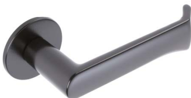
レバーハンドル:右(R)